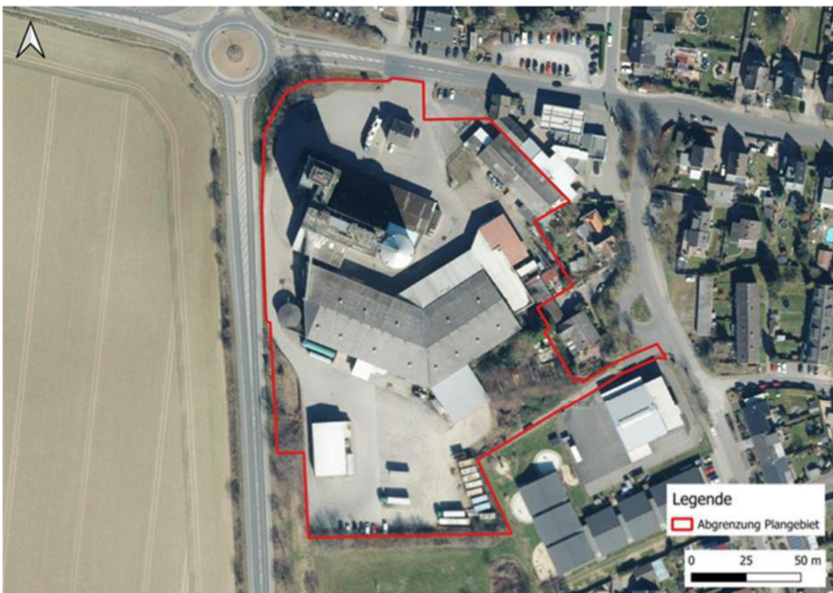
Abbildung 1: Abgrenzung des Änderungsbereichs im Luftbild

Im vorhabenbezogenen Bebauungsplan G44, der im Parallelverfahren aufgestellt wird, ist für dieses Gebiet ein Sondergebiet geplant, weshalb für den Änderungsbereich nun die Darstellung einer Sonderbaufläche mit Zweckbestimmung „Einzelhandel“ vorgesehen ist. Der ca. 24.000 m 2 große Geltungsbereich der 25. Änderung des Flächennutzungsplanes liegt am westlichen Siedlungsrand des Hauptortes von Nörvenich und umfasst den Bereich unmittelbar östlich der Bundesstraße 477 und südlich der Bahnhofstraße. Die B 477 und die Bahnhofstraße bilden daher die westliche und nördlich Grenze des Änderungsbereichs. Im Osten wird der Geltungsbereich begrenzt durch eine Tankstelle, Wohnbebauung und eine Kita. Im Süden bildet eine nördlich eines bisherigen Bolzplatzes Bestandsvegetation (Bäume und Sträucher) den Abschluss des Geltungsbereichs. Die Abgrenzung des Änderungsbereichs ist der Abbildung 1 zu entnehmen.