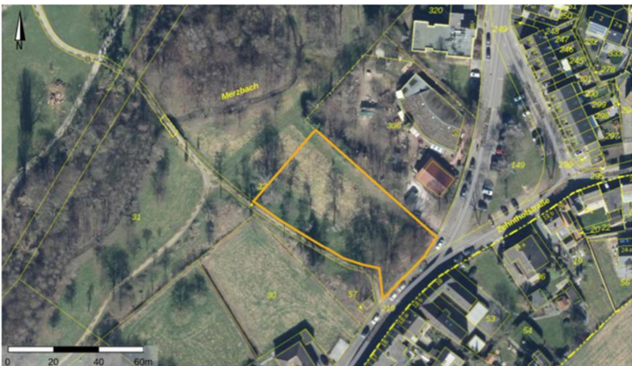
Abbildung 1: Luftbild mit Abgrenzung des räumlichen Geltungsbereichs (gelbe Linie), genordet (Land NRW, 2025)

Die erneute Offenlage erfolgt insbesondere aus formalrechtlichen Gründen. Darüber hinaus wurde die Eingriffsbilanz durch Neubewertung einer Hecke aufgrund der Stellungnahme der UNB angepasst. Das ökologische Defizit beläuft sich auf 8.888 Punkte- in der vorhergehenden Offenlage waren es 8.509 ökologischen Einheiten.