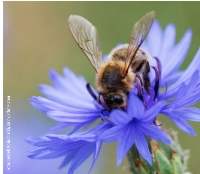
Bienen sind oft in heimischen Gärten unterwegs.