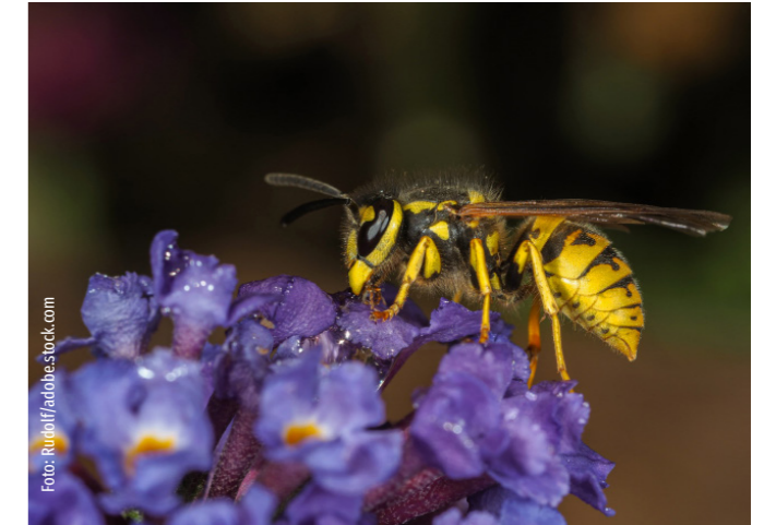
Wespen sind meist keine gern gesehenen Gäste.

Zusätzliche Informationen erhalten Sie im Internet z.B. unter: www.hymenoptera.de .