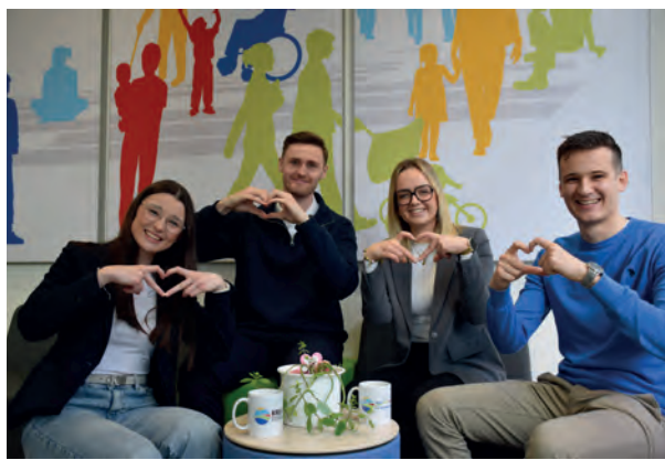
Ob Duales Studium oder Ausbildung: Die Nachwuchskräfte freuen sich über weitere Team-Mitglieder.

mit guten Chancen für die eigene berufliche Entwicklung. Flexible Arbeitszeitmodelle