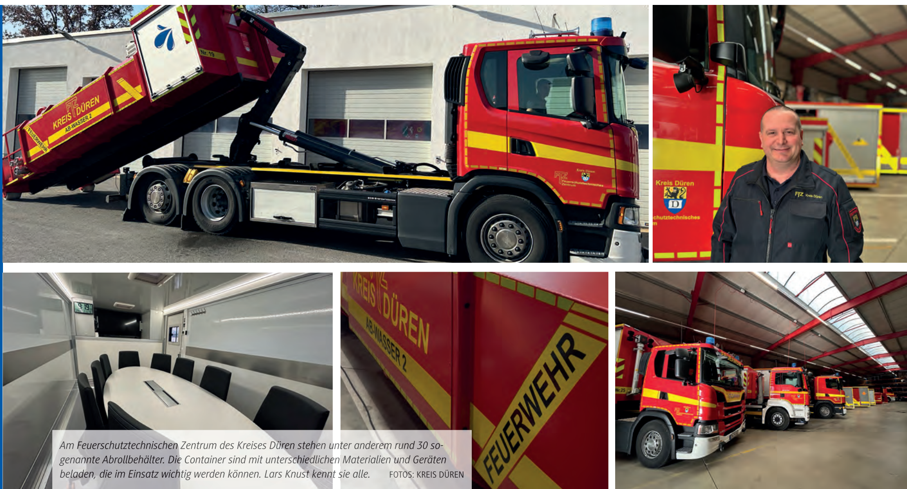
Am Feuerschutztechnischen Zentrum des Kreises Düren stehen unter anderem rund 30 sogenannte Abrollbehälter. Die Container sind mit unterschiedlichen Materialien und Geräten beladen, die im Einsatz wichtig werden können. Lars Knust kennt sie alle.